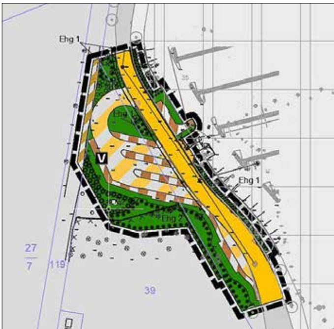
Abbildung – Auszug aus der Planzeichnung

Es liegen folgende umweltbezogene Unterlagen vor: