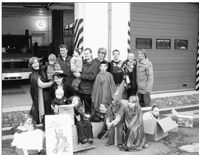
Halloween für die kleinen und großen Gäste

Am 31. Oktober 2008 hatte die Kinderfeuerwehr wieder zur Halloweenparty ins Feuerwehrhaus nach Stößen geladen. Dieser Einladung waren wieder einige kleine und große Gäste gefolgt. Auch aus dem Behindertenheim Schelkau waren Kinder und Betreuer nach Stößen gekommen. Alle Gäste waren kostümiert, die Gesichter geschminkt und hatten gute Laune mit gebracht. Die Gespenster hatten das Feuerwehrhaus voll in ihrer Macht, denn aus allen Ecken spukte es. Natürlich gab es auch Kaffee und selbst gebackenen Kuchen für die Eltern und Großeltern und für die Kinder gab es Kakao. Wer wollte konnte auch Würste am Spieß über den Feuer braten. Die Kinder hatten viel Spaß bei den verschiedenen Spielen, wie z. B. das Mumienspiel. Auch die kleinen Malkünstler kamen an diesem Tag nicht zu kurz.