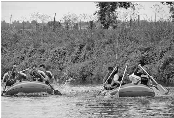
Team 21 (rechts) gegen SV Germania 99 (Platz 4)

bestens vorbereitet. Für das leibliche Wohl wurde mit Fischbrötchen, Leckerem vom Grill und einer großen Auswahl von Getränken gesorgt. Für die Absicherung auf dem Wasser und den Aufbau der Strecke sorgte die örtliche Feuerwehr.