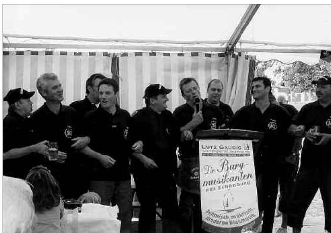
Ihr seid auch als singende Feuerwehrmänner super !!!

Die Kindertagesstätte Punkewitz (die Kleinen Strolche) möchten sich bei der Feuerwehr Punkewitz bedanken.