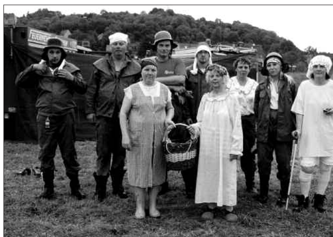
Die Görschener Weber in ihren „Shownachtgewändern“

Die Feuerwehr Punkewitz/Der Feuerwehrverein Punkewitz e. V.