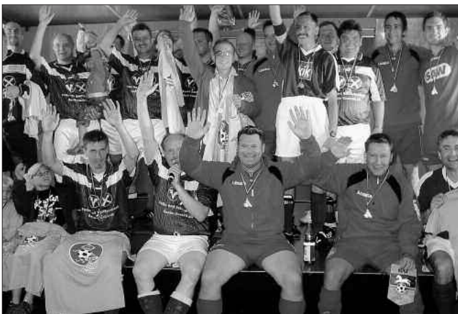
Große Stimmung herrschte bei der Siegerehrung

Gegner war das Allstarteam der SV Mertendorf. Zuvor wurden noch Sterne des Sports an besonders aktive Sportgemeinschaften aus der Region verliehen. Ein Fußballvorspiel zwischen der Lebenshilfe Naumburg und den Caritaswerkstätten eröffnete den sportlichen Teil. Im „Hauptspiel“ des Abends konnten nach wechselndem und spannendem Spiel die Mertendorfer Allstars, nachdem das Ergebnis 6 : 6 unentschieden war, im Elfmeterschießen mit einem 4 : 3 den Sieg für sich verbuchen.