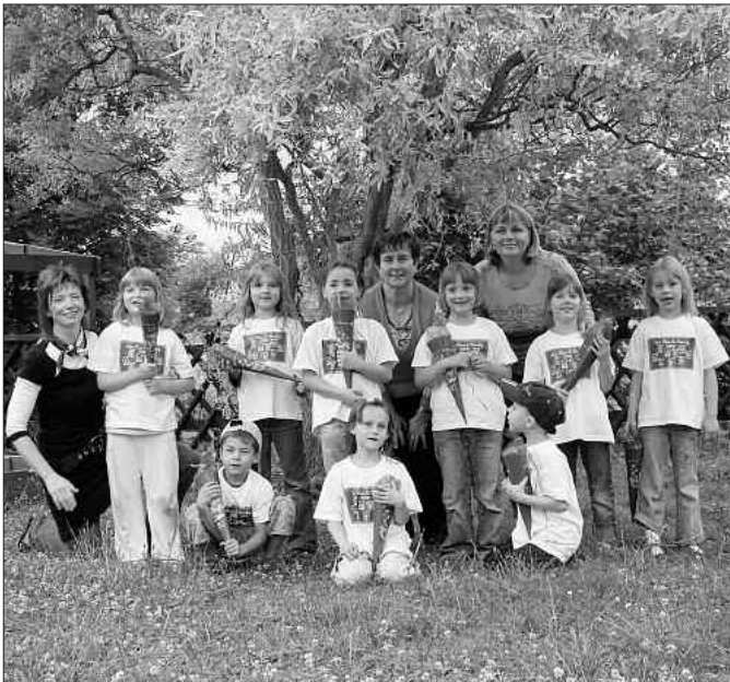
Viel Freude in der Schule. Dies wünschen von ganzem Herzen das Erzieher-Team „Max und Moritz“ in Stößen

Dazu wünschen wir Ihnen und Ihren Kindern alles erdenklich Gute.