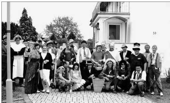
Die Pfingstburschen beim „Eierbettel“ in Droitzsen.

Auch zum traditionellen Eierbetteln, eine Woche nach Pfingsten, zog man in verschiedenen Kostümen durch die Gemeinde. Man bracht wieder viel Freude den Bürgern und diese gaben auch kleine Geschenke, aber nicht nur Eier. Die musikalische Band war auch an diesem Sonntagabend wieder, die „Lustigen Musikanten“ aus Apolda. Am Abend spielte dann die Disko in der Hopfenhalle Görtschen.