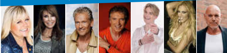
Gaby Baginsky, Ireen Sheer, Olaf Berger, Peter Orloff, Vincent Gross, Loona und Olaf Henning