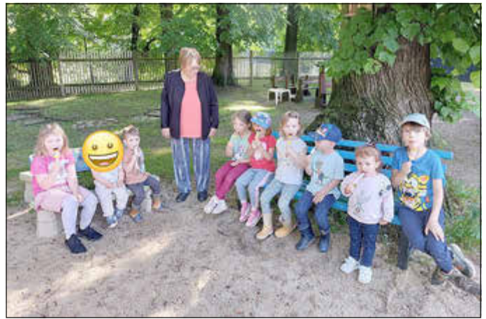
Bis zum nächsten Mal sagen eure Parksternchen aus Meineweh