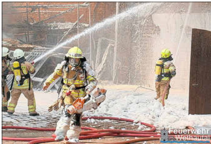
Text u. Fotos: Feuerwehr Wethautal

gement konnte eine weitere Ausbreitung des Brandes verhindert und die angrenzende Bebauung erfolgreich geschützt werden.