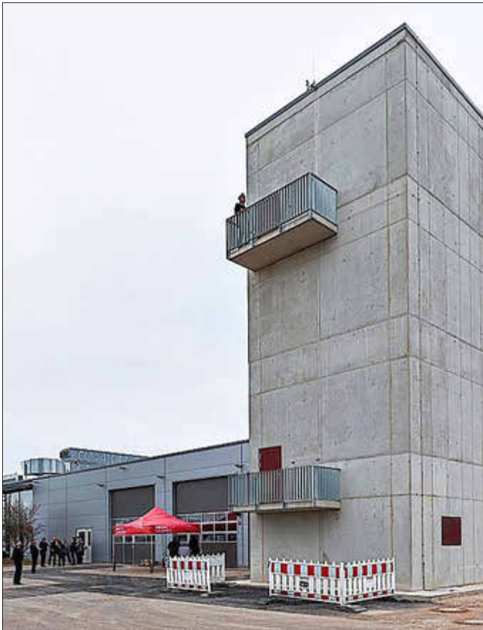
Markanter Gebäudeteil: der Turm zum Trocknen von Schläuchen.

Das gesamte Gefahrenabwehrzentrum wird mehrere Einrichtungen bündeln, darunter: