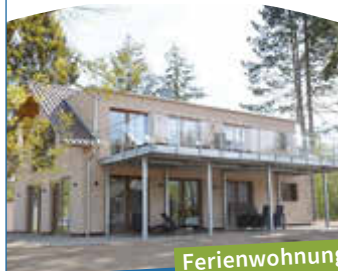
Ferienwohnung Edith Panorama