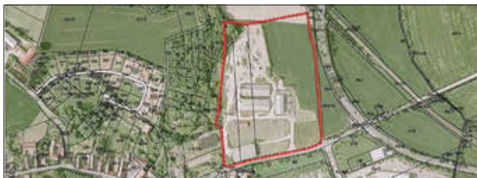
Abbildung 1: Luftbild mit Geltungsbereich (rot markiert)

Die Offenlage wird hiermit öffentlich bekannt gemacht.