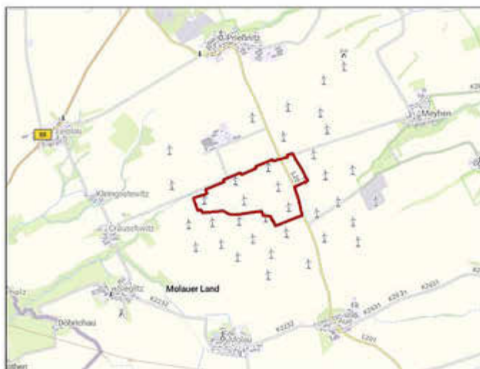
Übersichtskarte mit Darstellung des Geltungsbereiches des B-Planes Nr. 2 „Windpark Leislau“

Im Rahmen der frühzeitigen Öffentlichkeitsbeteiligung gem. § 3 (1) BauGB liegt der Vorentwurf zur Aufhebung des Bebauungsplanes Nr. 2 „Windpark Leislau“ in der Zeit