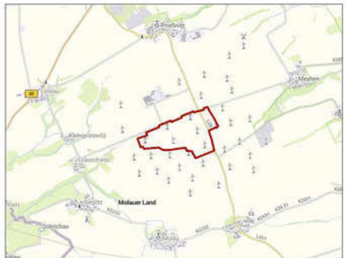
Übersichtskarte mit Darstellung des Geltungsbereiches des B-Planes Nr. 2 „Windpark Leislau“

gez. Barth zweiter stellvertretender Bürgermeister der Gemeinde Molauer Land