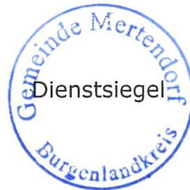
Armin Kunze Bürgermeister